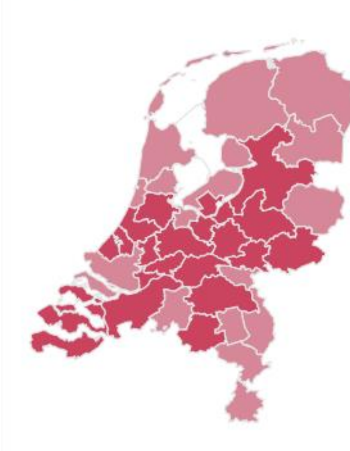
Spanning per arbeidsmarktregio

De krappe arbeidsmarkt blijft nog wel even bestaan